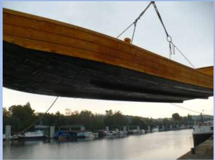
Skládání ve smíchovském přístavu a osazení kormidla