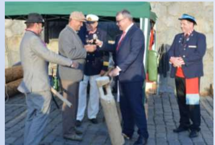
Ministr dopravy převzal od purkareckých plavců tzv. „výtoň“ - kládu vytnutou z posledního voru postaveného v Praze